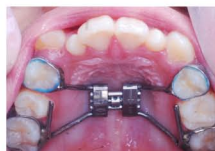
少しずつ左右に広がっていきます。

4カ所の金属製のバンドとスクリュー(ネジの部分)をしっかり和歯にくっつけるのが基本形です。1回につき90度スクリューを回転させることで、1回に約0.2mm広がりますが、これを週2回行うことで徐々に上顎骨を広げます。歯のバンドとしっかりと接着させますので充分な効果が得られます。