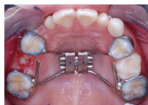
スケルトンタイプの固定式拡大装置

上顎を拡大する装置は、患者さん自身が取り外しのできない「固定式拡大装置」をおすすめしています。固定式装置は取り外しができないため大がかりなイメージですが、24時間仕事をし続けるので効果が確実です。固定式装置の中でもスケルトンタイプの拡大装置は、あまり違和感もなく正中口蓋縫合を広げることができ、優れていると言えます。